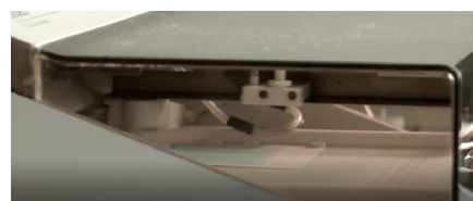
Boquilla de pulverización