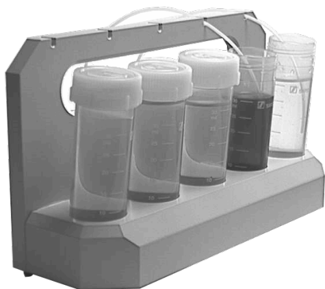
Soporte para botellas de reactivos

Las ventajas frente a la pulverización manual son una cantidad de reactivo significativamente reducida, un patrón de pulverización muy uniforme y la evitación de la formación de aerosoles. La aplicación de los reactivos se realiza con la máxima precisión y es reproducible en todo momento. Este dispositivo, que permite realizar operaciones de CCF de acuerdo con las prescripciones GLP, protege la salud del usuario contra cualquier riesgo químico (inhalaciones y salpicaduras). El ChromaJet DS20 puede funcionar de forma autónoma o conectado a un PC. Con un software especial, se pueden crear, guardar y cargar diferentes métodos de pulverización.